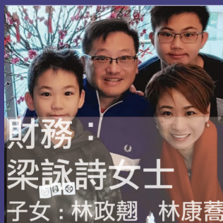
財務： 梁詠詩女士 子女：林政翹 林康蕎