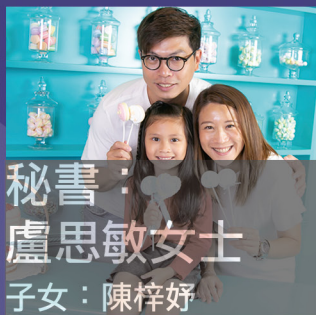
秘書： 盧思敏女士 子女：陳梓好