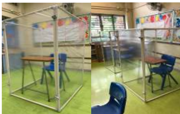
學校地下 G08 室改作防疫醫療室，設有獨立休息區和保護屏風，照顧發燒或懷疑有 2019 冠狀病毒症狀(如乏力、乾咳及呼吸困難等)的同學。