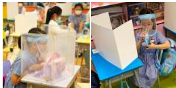
小休時，學生需豎立桌上飛沫屏風桌上飛沫屏風，或戴上學校所贈的防疫帽以阻隔飛沫。