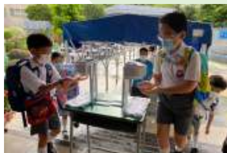
進入校門，學生均需消毒雙手。而校園四處設置感應式酒精消毒液機，以便學生有需要時消毒雙手。