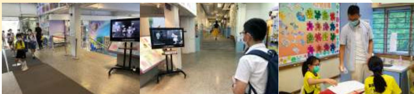
學校玻璃門大堂設「體溫監測站」，安裝「紅外線體溫探測儀」量度學生、教職員、小休後，老師協同學消毒桌面。家長和訪客的體溫。