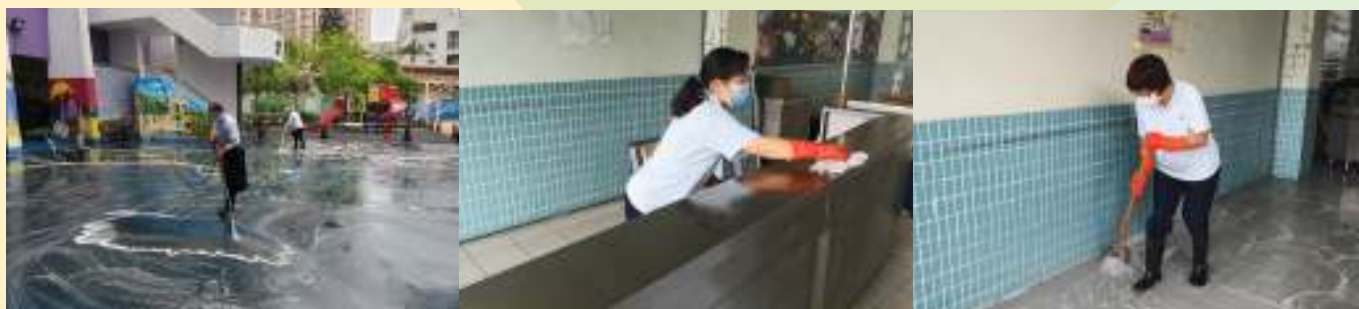
學校已全面大清洗所有課室、特別室、禮堂和走廊。每天使用漂白水清潔消毒校園所有的課室和禮堂，確保環境清潔衛生。