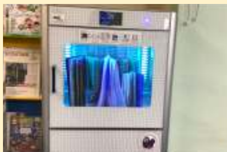
圖書館增設「紫外線圖書消毒機」加強圖書清潔和消毒。