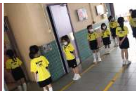
學生沖廁前需蓋上廁板，學校已為廁板加裝手把，並於洗手門對出空地貼上標貼，以供學生輪候時保持社交距離。