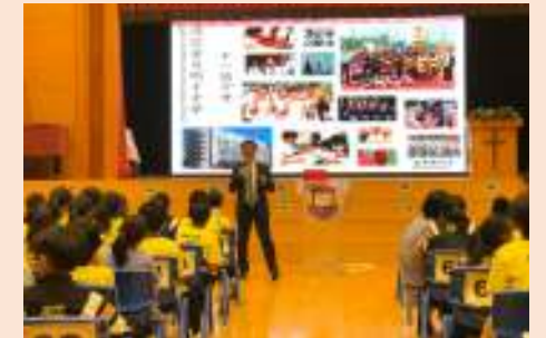
浸信會呂明才中學中一入學講座