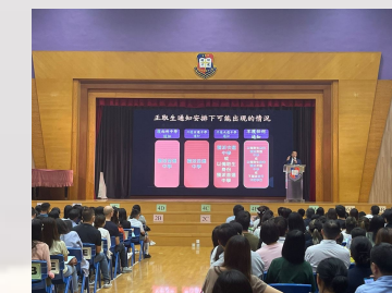
自行選校升中家長晚會暨 我們這一級(小六) 2023-11-10