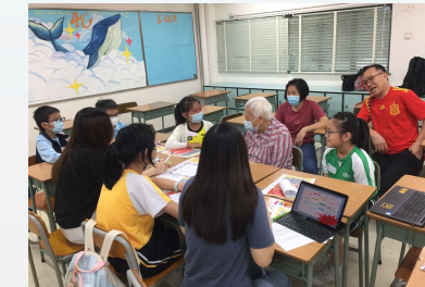
小社工訓練計劃暨沙呂好公民實踐活動 — 長者表達藝術工作坊 2023-10-28