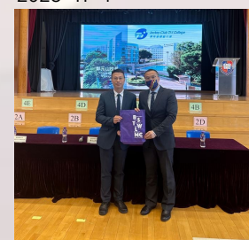
賽馬會體藝中學 中一入學簡介會 2023-11-17