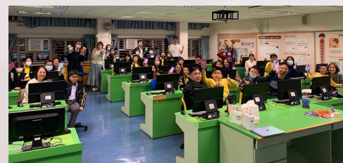
《一小時玩程式》親子工作坊 (小四至小六) 2023-11-17