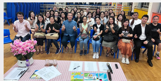
親親校長 (小五小六) 2023-10-30