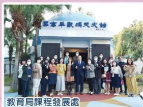
教育局課程發展處