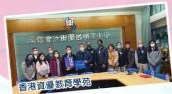
香港資優教育學苑