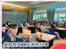
與友校同工交流和分享