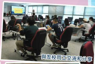
與友校同工交流和分享