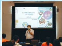
小學教育課程指引工作坊