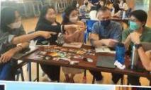
同覓初心－共建師生小確幸