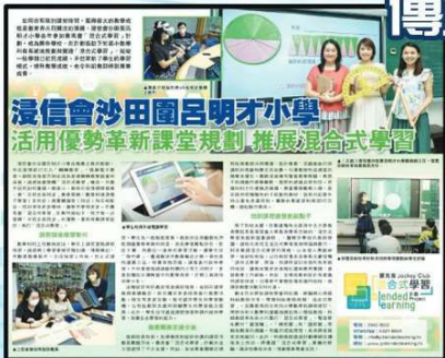
活用優勢革新課堂規劃 推展混合式學習 (2023年6月20日《明報》)