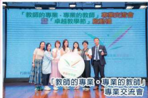
「教師的專業·專業的教師」專業交流會