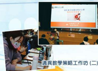
適異教學策略工作坊 (二)