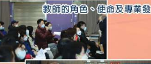
教師的角色、使命及專業發