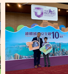
「全民國家安全教育日」 開幕典禮暨主題講座 2024-4-15