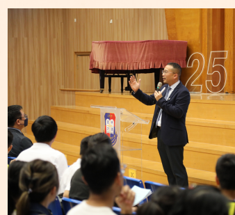
中學統一派位小六升中 家長晚會 2024-4-12