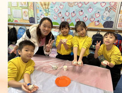
二年級中文科活動「包餛飩」 2024-3-7