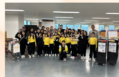
每月關懷-「書出愛心·十元義賣親子 義工分書活動」 2024-3-2