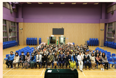
四年級「我們這一級」 2024-3-7