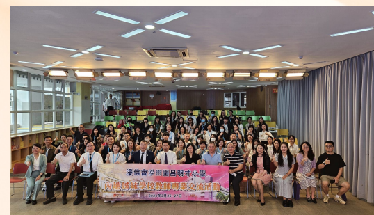
內地姊妹學校教師專業交流活動 2024-3-26 至 2024-3-27