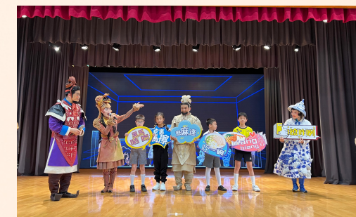
西安兒童藝術劇院《我們是秦俑》兒童劇 2024-4-9