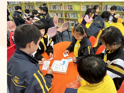
賽馬會跨代學習與閱讀計劃 2024-3-4