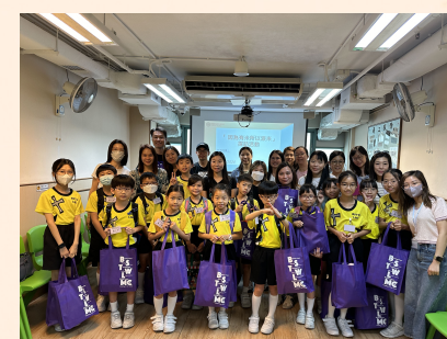
每月關懷-「沙呂暖Love Love」 社區探訪活動 2024-4-13