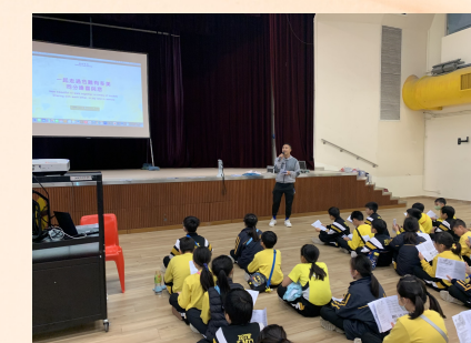
四年級福音營 2024-3-29 至 2024-4-1